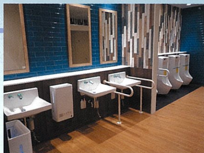
ショッピング センター