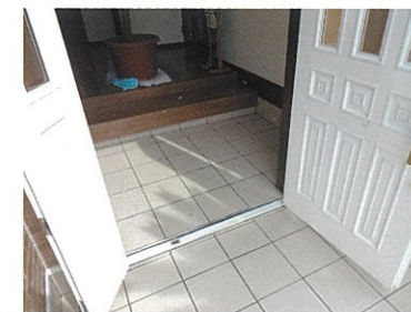
タイル・石材コート